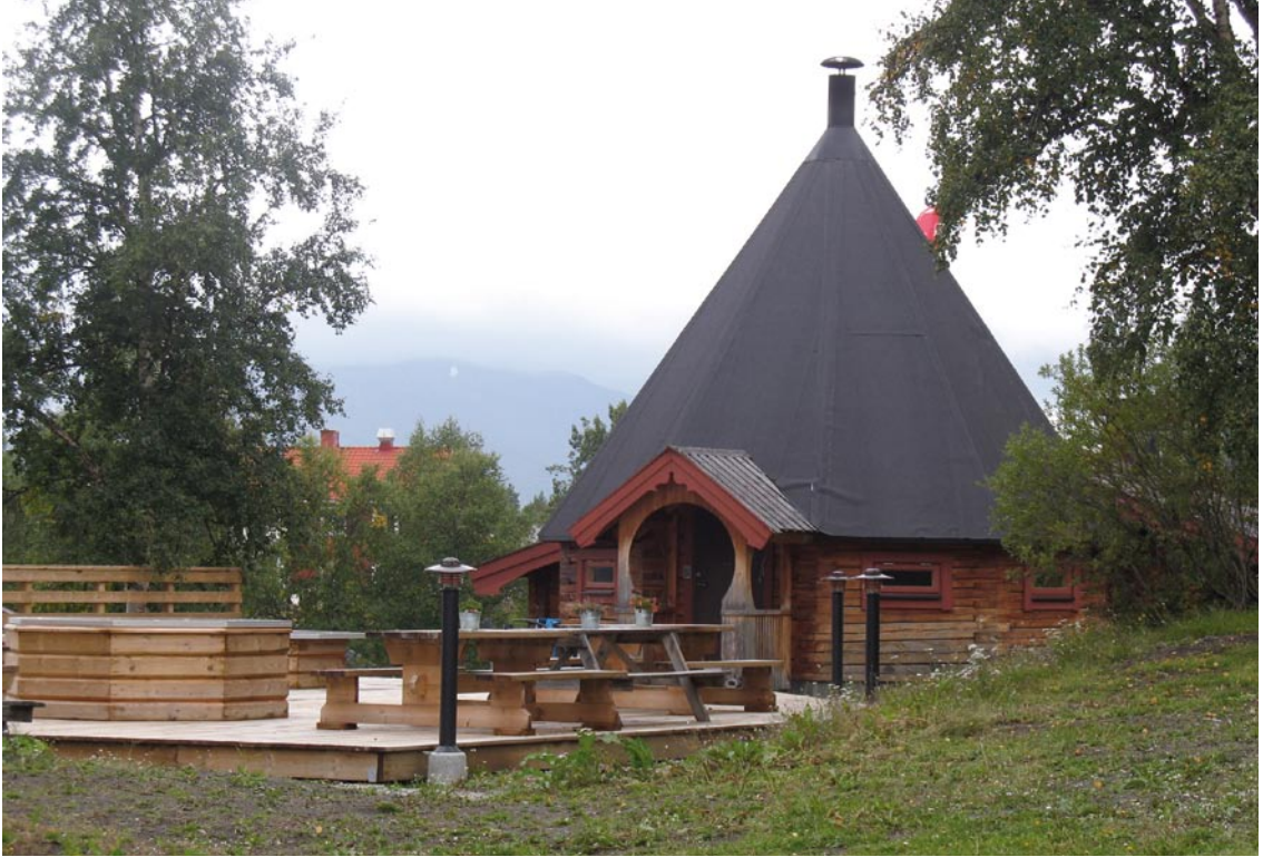
Bastun i Vålådalen är inspirerad av samiskt formspråk.