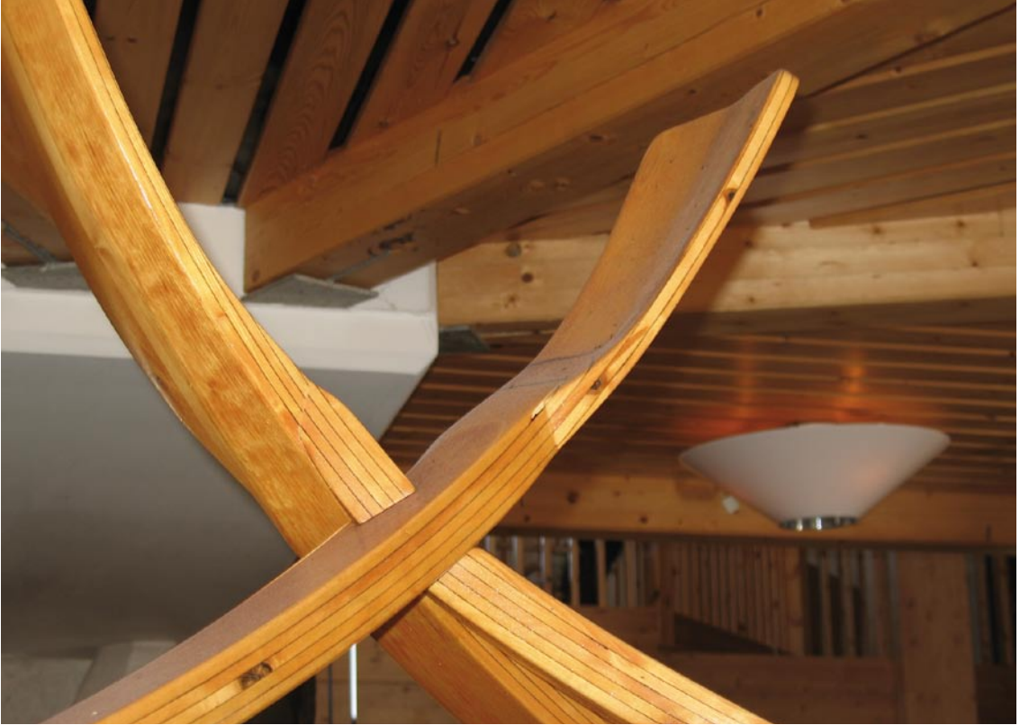
Serveringsbordet på Storulvåns fjällstation.