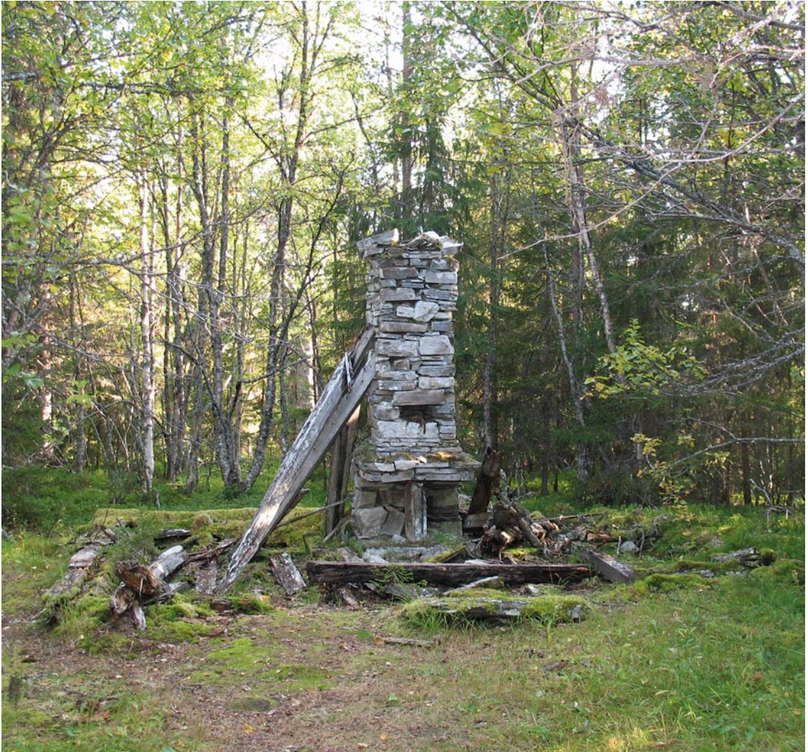
Husgrund i Nyhem.

Nyhem, på samiska Markenjärä (= gammalt sommarviste) några km nordväst om Vålådalen, var Tranrissamernas höst- och vårviste. Tidigt på 1900-talet övergav ett par familjer den traditionella torvkåtan och byggde stugor. Några av byggnaderna används fortfa-