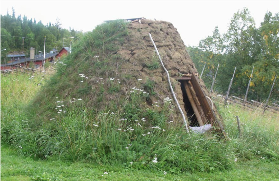
En nyuppförd kåta utanför naturum i Vålådalen symboliserar platsens ursprung.

lite överallt, både uppe i fjällbjörkskogen och längre ned i barrskogsområdet.