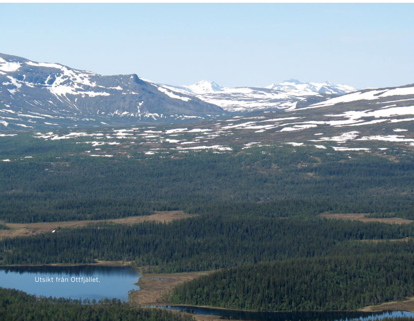
Utsikt från Ottfjället.

sedan. Framförallt är det ett samiskt kulturlandskap och ett storskaligt beteslandskap präglad av tusentals år med renbete. STF:s anläggningar i Storulvån, Vålådalen, Stensdalen och Anaris ligger samtliga på eller intill gamla samiska miljöer. I broschyren får du lära känna dem närmare.