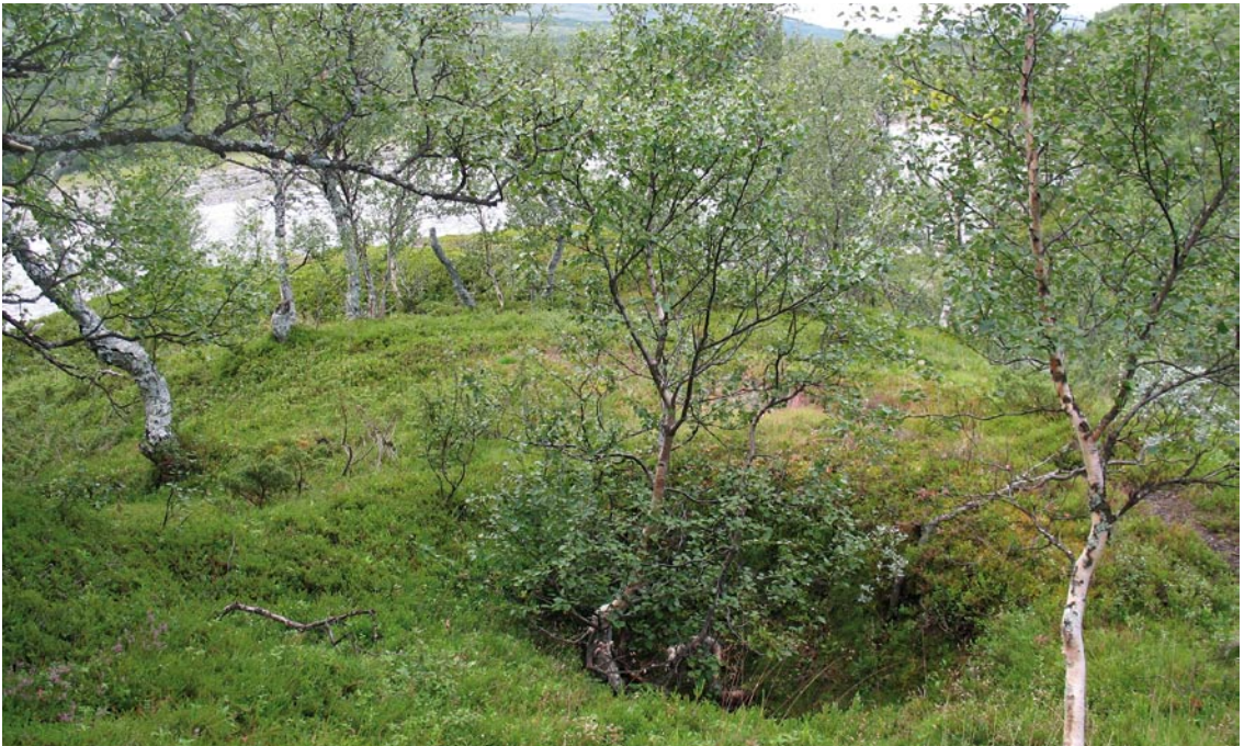
Samerna var från början jägare och samlare. Fångstgrop vid Handölan.

Familjerna flyttade med renarna i ett årligen återkommande mönster. Höst- och vårvistena låg i fjällbjörkskogen nära trädgränsen. Där bodde man i torvkåtor och där hade man bodar för utrustning som inte behövdes under resten av året. Vintern tillbringades i skogslandet eller vid kusten. Under högsommaren flyttade man med renarna högre upp mot kalvfjällen med närhet till snöfläckar där renarna kunde söka svalka och skydd mot besvärliga insekter.