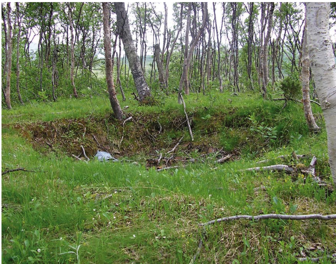
En renvall har i okunskap fått återanvändning som skräpgrop.

det gäller automatiskt, det behövs alltså inget särskilt beslut för att det ska träda i kraft. Det står inte angivet i lagen hur gammal en lämning ska vara för att betraktas som fornlämning. Exempel på fornlämningar i samiska miljöer är eldstäder, mjölkgropar, bengömmor, gravar och offerplatser.