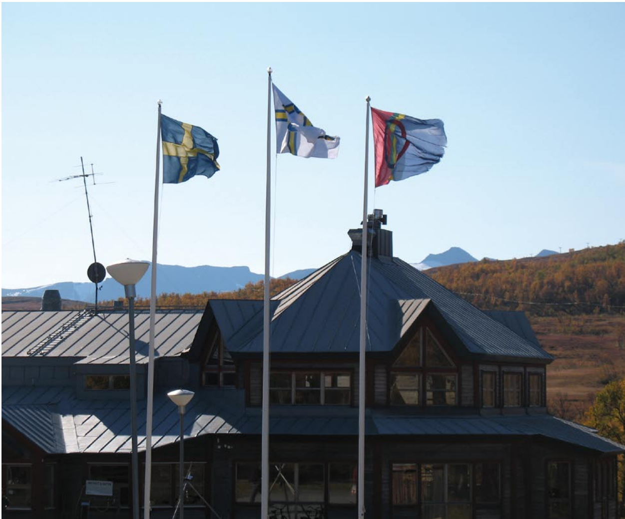
Sida vid sida vajar den samiska, svenska och STF-flaggan.