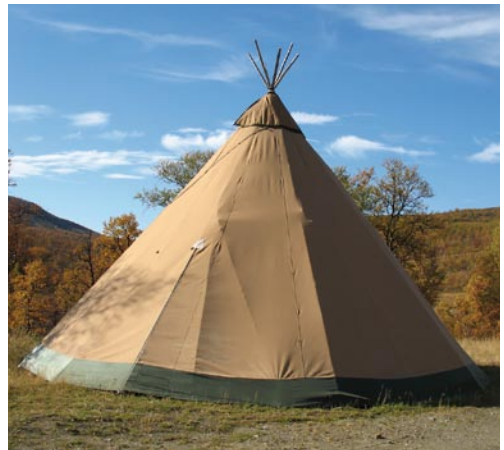
Lavvo, modern tältkåta.