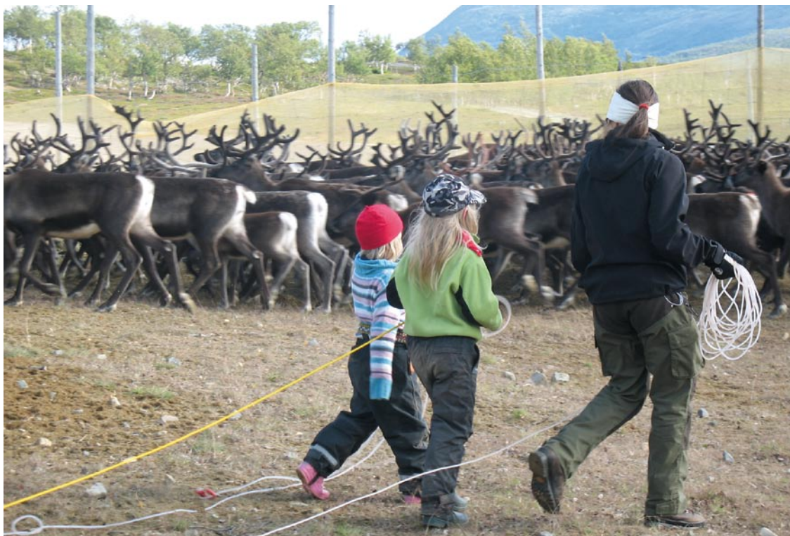
Kalvmärkning i Tåssåsens sameby.

Under första delen av 1900-talet ersattes den intensiva tamrenskötseln allteftersom av storskalig extensiv renskötsel med fokus på köttproduktion. Mjölkning och daglig vallning har sedan länge upphört. Renhjordarna är stora och rör sig fritt över ansenliga områden. Tekniska hjälpmedel gör att renskötare snabbt kan förflytta sig och det gamla bosättningsmönstret har förändrats. Familjerna är bofasta och ofta kan renskötare pendla mellan hemmet och arbetsplatsen där renhjorden