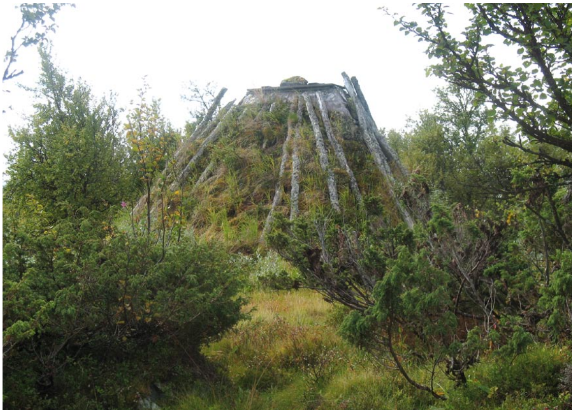
Gasngese, förleden i Gasngesetjuegkele, betyder enbuske. Och ene finns det gott om.

gärdet strax intill kåtorna. De båda kåtorna rustades upp sommaren 1992. Ibland används de av samebyn för turistisk verksamhet. Rengärdet är fortfarande lätt att se – det är mycket grönare än omgivningen på grund av att renarna har gödslat marken.