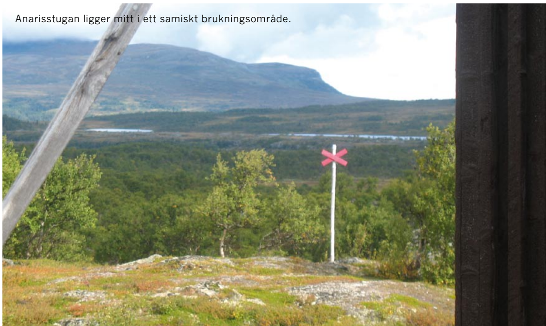
Anarisstugan ligger mitt i ett samiskt brukningsområde.

Anarissets före detta lappby ingår idag i Tåssåsens sameby.