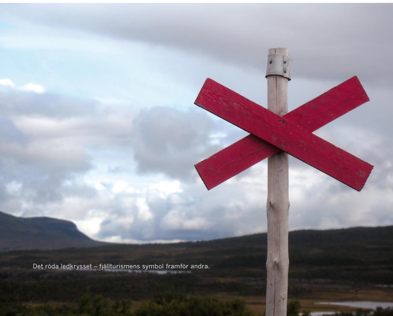
Det röda ledkrysset – fjällturismens symbol framför andra.

hit för att andas av den friska hälsogivande fjällluften. Några år senare anlände de första ripjägarna och sportfiskarna, ofta från England och Skottland, ibland från södra Sverige. De första turisterna tillhörde samhällets övre skikt.