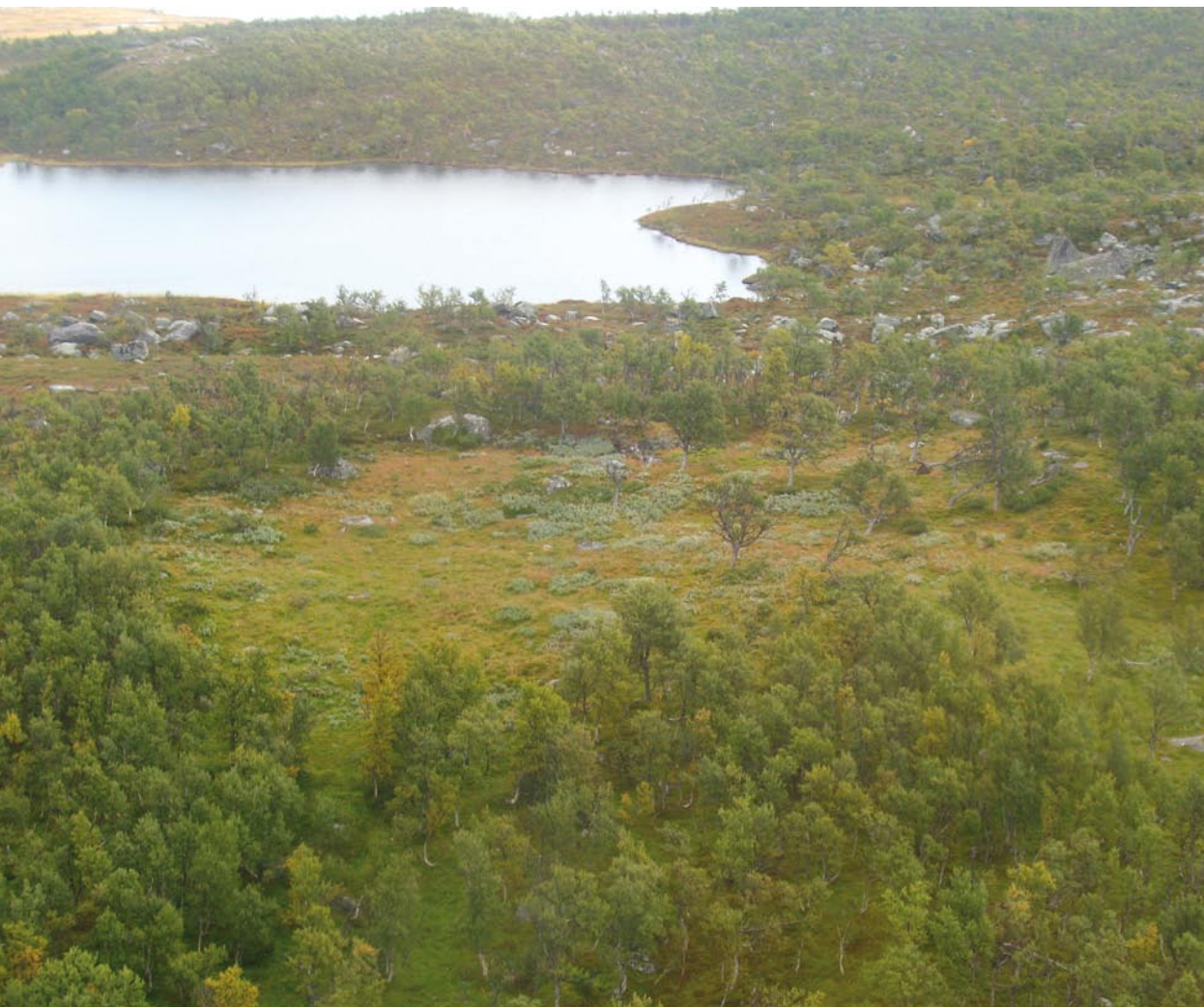
Renvallen lyser som en grön rundel i fjällbjörkskogen.