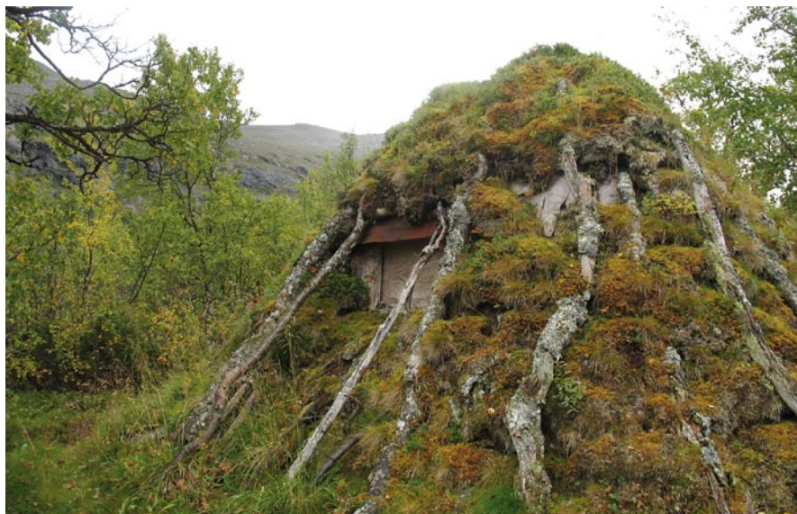
Hushållskåtan i sommarskolan.

hade oftast många mil till hemmet och det var inte så många gånger under skolåret som de kunde resa hem. Tänk att lämna en liten sjuåring så långt hemifrån för flera månader.