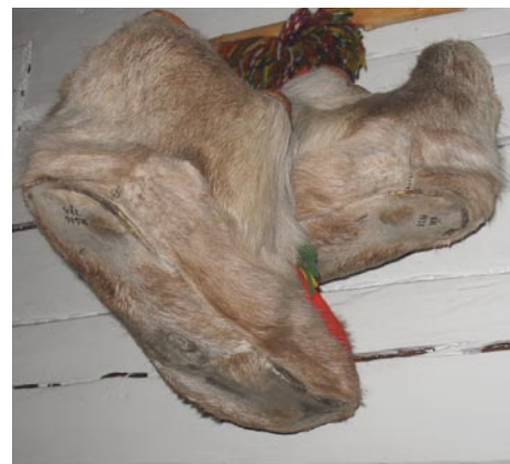
Samiska föremål i Vålådalens turiststation.